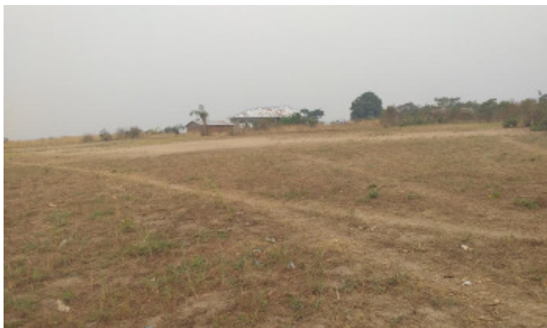
Terreno dove verrà costruita la scuola materna. Sullo sfondo la Missione di Idiofa, in via di ultimazione.

per continuare lo sforzo di accrescere le strutture scolastiche e ricettive, iniziate con la costruzione dei due edifici del complesso scolastico "Bumosi", le Suore Missionarie del Lieto Messaggio hanno pensato di costruire una scuola materna dignitosa nello stesso complesso.